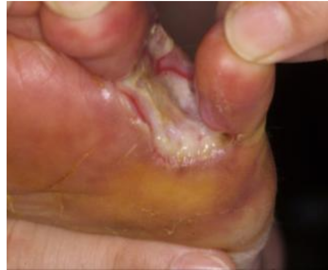
趾間部の動脈性潰瘍