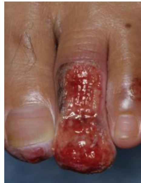
足趾部の糖尿病性潰瘍