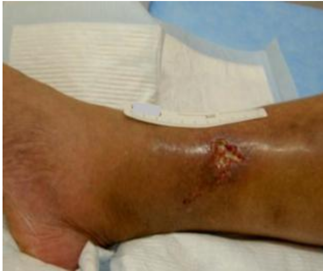
下腿の静脈性潰瘍