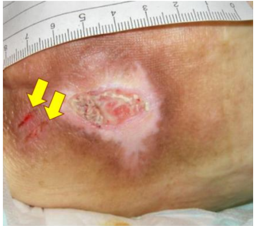
仙骨部褥瘡部の保護で貼付していた 医療用テープ剥離時に発生したテア カテゴリー3