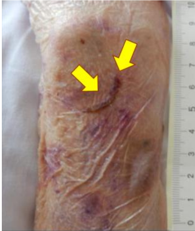
リハビリテーション時に支持 した際に発生した手関節 周囲部のテア カテゴリー1b